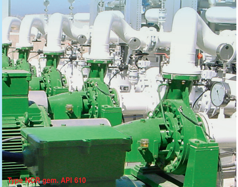
Type NCR gem. API 610

Dickow Pumpen KG Siemensstraße 22, D-84478 Waldkraiburg Telefon 08638/602-0, Fax 08638/602-201 E-Mail: verkauf@dickow.de · export@dickow.de Internet: http://www.dickow.de