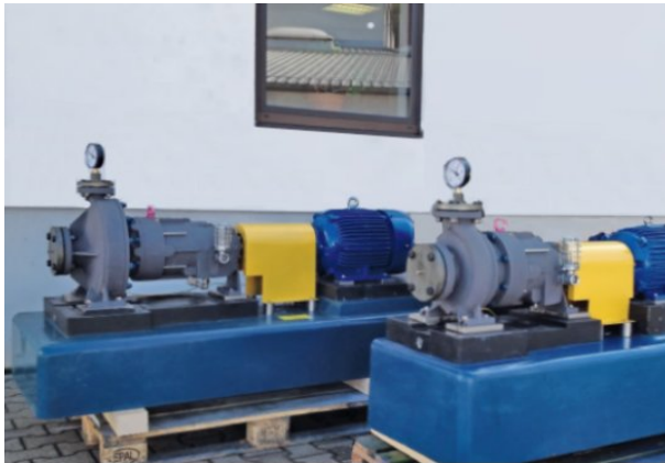
Dickow-Projektmanager für Sadara, und zwei der besonders ausgeführten, magnetgekuppelten Pumpen mit Zubehör

Dickow Pumpen KG, Siemensstraße 22, D-84478 Waldkraiburg